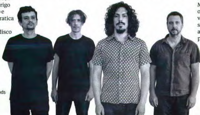
Clocks and Clouds

Para investir nesta área não são necessários conhecimentos técnicos sobre CDOs, ABSs, MBs ou CMOs, bastam duas orelhas e espírito aberto. É verdade que corre o risco de sentir-se ultrapassado pelos acontecimentos, mas também pode ser o concerto da sua vida.